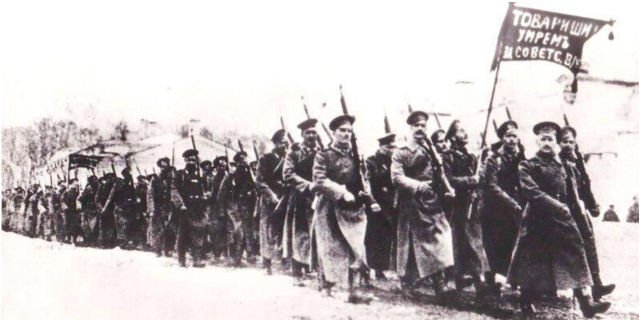
Отряд Псковских красногвардейцев. 1918 год.

23 февраля наша страна отмечает День защитника Отечества. Свое нынешнее название праздник получил только в 1995 году. Предлагаем вам узнать, как возник и менялся праздник, а также какие названия носил раньше.